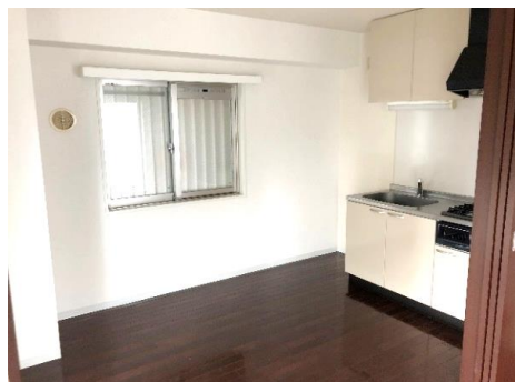
※同タイプ別室の写真です