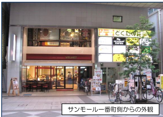
サンモール一番町側からの外観