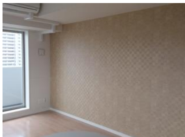
※※完成時の同タイプ室内写真です※※