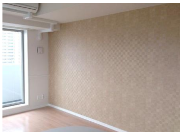
※※完成時の同タイプ室内写真です※※