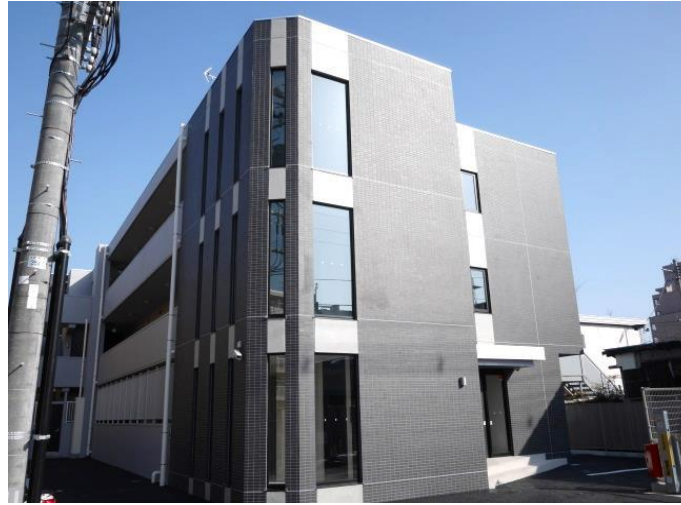
※同タイプ別室の写真です