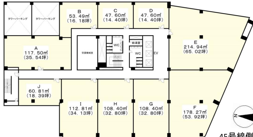
【基準階平面概略図】

2階E室は214.86㎡(64.99坪)となります 2階FG室は266.64㎡(80.65坪)となります