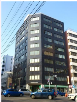
青葉通り沿いの好立地♪