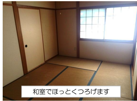
和室でほっとくつろげます