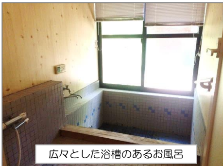
広々とした浴槽のあるお風呂